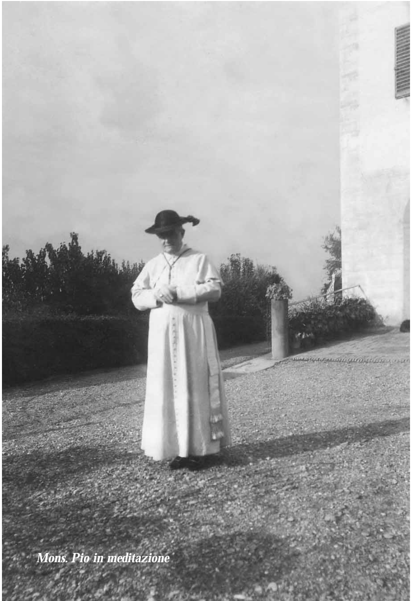
Mons. Pio in meditazione