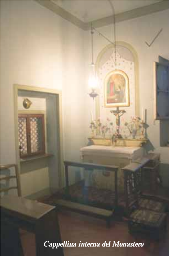
Cappellina interna del Monastero

storico convento di S. Marco di Firenze, ove rimase nei suoi venti anni di vita religiosa, prima di essere nominato vescovo ausiliare di s. Miniato dal b. Pio IX mentre era priore del convento all'età di 38 anni. Esercitò il ministero sacerdotale insegnando, predicando e confessando e nella direzione spirituale condivise il suo ideale di costituire un nuovo monastero domenicano nel quale, da vere domenicane, le monache si sarebbero dedicate allo studio