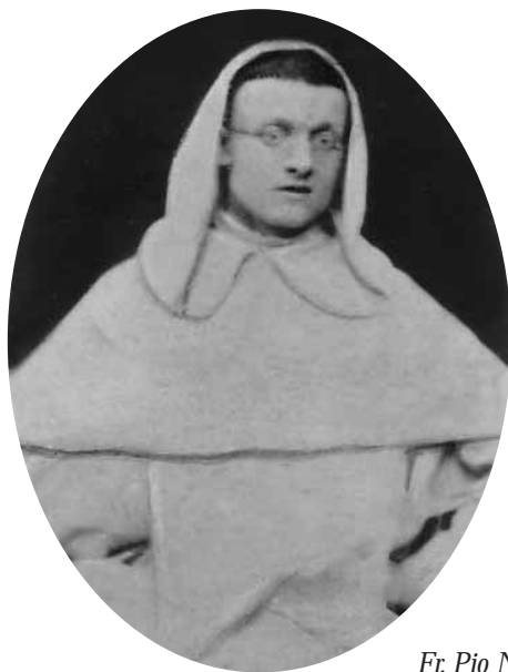
Fr. Pio Novizio Domenicano