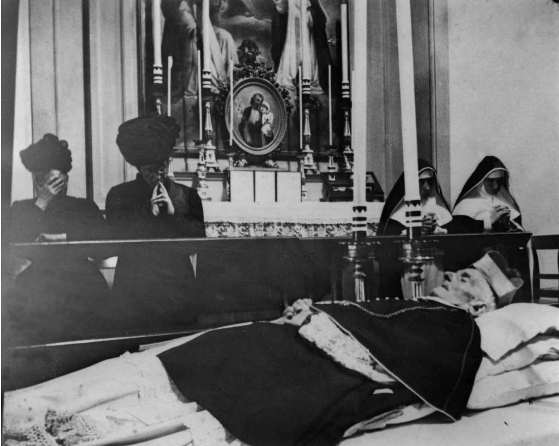
Morte di Mons. Pio il 15 agosto 1912

Maria forma a lui un cuore serafico che si strugge amando e si distilla in lacrime; gli infonde un amore di madre per le sciagure degli uomini che egli compassionando trae nell'anima sua. Non troviamo santo che si appenasse così teneramente e si disfacesse dentro per intima lacerazione ineffabile come Domenico.