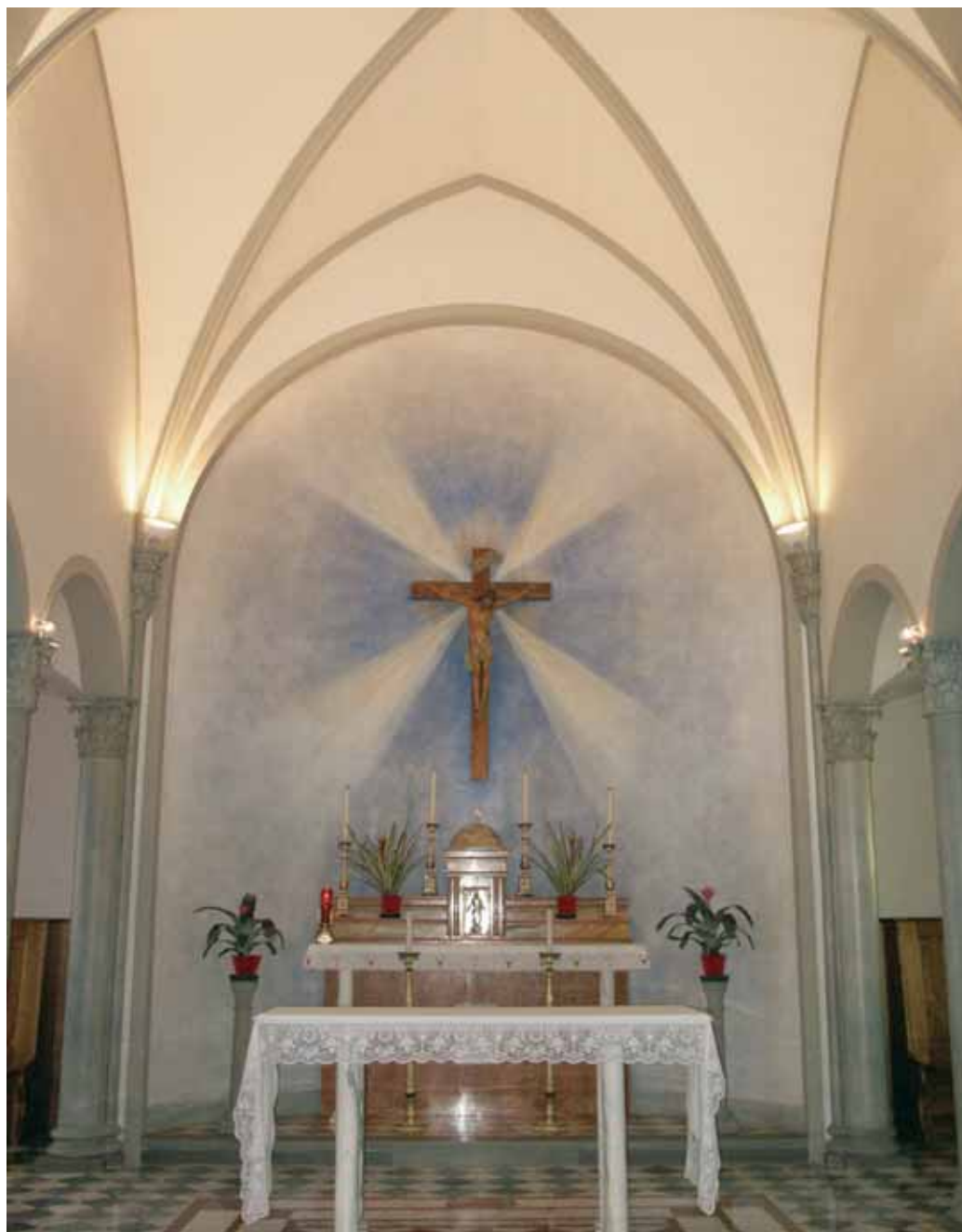
CHIESA DEL MONASTERO DELLE SUORE DOMINICANE VIA BOLOGNESE, 111 - FIRENZE